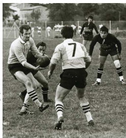
4F1108 - Castres - Stade du Rey - Match de rugby à XIII

Les Archives municipales de Castres veillent sur un patrimoine multiséculaire, riche d'informations sur le passé. Elles abritent des documents, publics et privés, qui ont été collectés en raison de leur intérêt majeur pour la connaissance du territoire et de ses habitants.