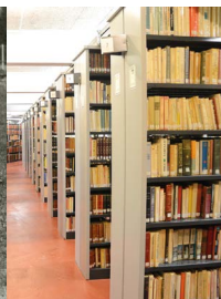
Réservé des Archives municipales