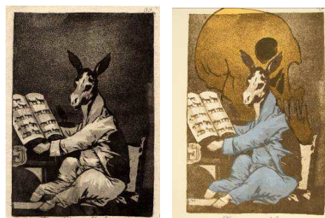
Les Caprices de Goya et Dalí, 1798/1977

1 visite + 2 ateliers - cycle 2 - 3 et secondaire