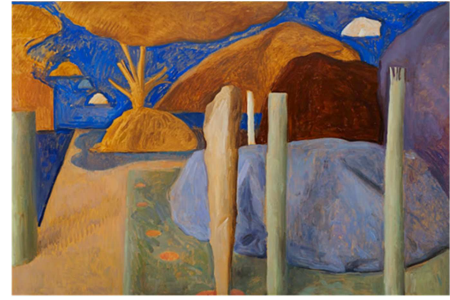
Bleu ciel, 2013 - huile sur toile

1 visite + 2 ateliers - cycle 2 - 3 et secondaire