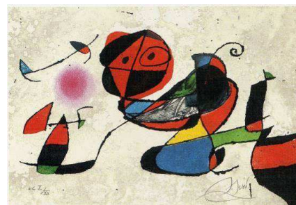
Joan Miró Série Gaudí, Planche XIII, 1979