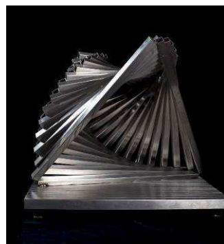
Spirale, 2007 - Acier inox

1 visite + 2 ateliers - cycle 2 - 3 et secondaire