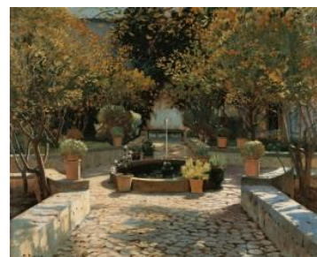
Santiago Rusiñol y Prats (1861-1931) La Cours des orangers , 1904 Huile sur toile H. 0,87 m ; L. 1,075 m

Au musée Goya, 1 atelier de 2h autour du thème de la couleur.