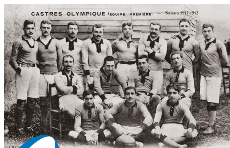
L'équipe de 1912-1913

Le CO atteint la finale du championnat des Pyrénées de 2 e Série.