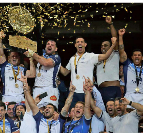
Champion du championnat