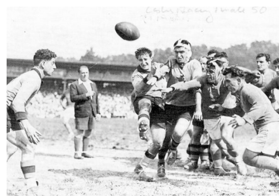
Finale 1949