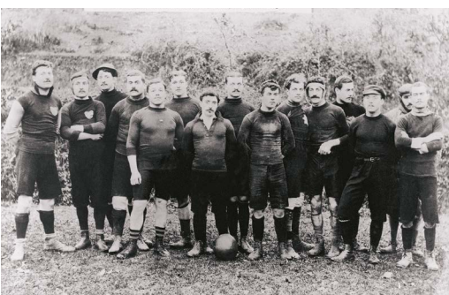
1906 : première équipe du Castres Olympique