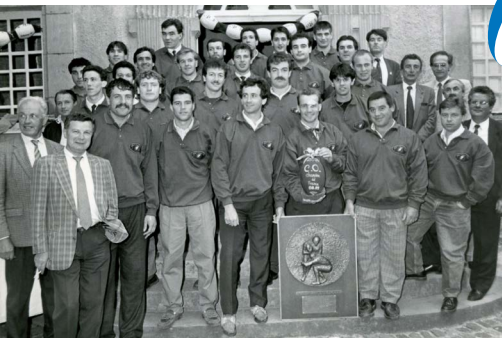
Les champions de France de Groupe B 1989