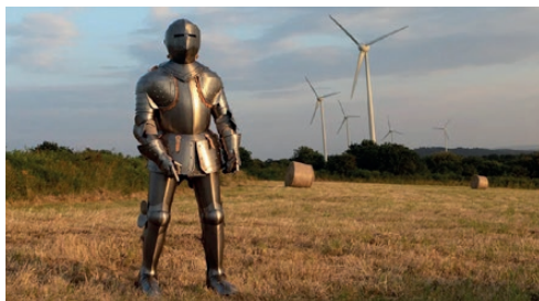
Abraham Poincheval - Le Chevalier errant, L'homme sans ici , 2018

Inspiré par la figure mythique de Don Quichotte, l'artiste Abraham Poincheval décide en 2018 de se créer une armure de chevalier et de sillonner la Bretagne à la rencontre de ses habitants. Dans cette performance, il fait revivre l'anachronique anti-héros inventé par Miguel Cervantès en 1605 et réhabilite la poésie de l'absurde. Les moulins à vent deviennent alors des éoliennes, et les habitants découvrent un chevalier venu d'un autre temps dans un jeu de juxtaposition du passé et du présent. L'armure et la vidéo réalisées à l'occasion de cette performance sont présentées au musée Goya, après avoir été montrées au Mucem à Marseille dans le cadre de l'exposition Don Quichotte, histoire de fou, histoire d'en rire . Ces œuvres permettent d'évoquer, non sans humour, une grande figure de la littérature espagnole qui continue à inspirer les artistes d'aujourd'hui.