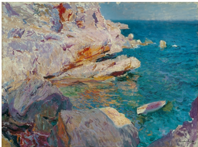
Joaquín Sorolla Bastida (1863-1923) - Les Rochers de Jávea et le bateau blanc , 1905 Musée Carmen Thyssen, Málaga

Si les grands noms de l'art espagnol de la fin du XIX e et du début du XX e siècles sont mondialement réputés (Dali, Miró, Picasso, etc.), une large partie de la création artistique de cette période reste aujourd'hui encore méconnue. Pourtant, de nombreux artistes actifs entre les années 1880 et 1920 ont fait preuve d'une grande vitalité et inventivité, notamment dans le domaine du paysage, en peignant des scènes de plein air animées de somptueux effets de lumière, dans le sillage de certains peintres impressionnistes et postimpressionnistes.