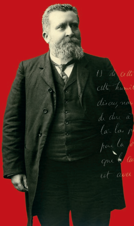
Jean Jaurès, vers 1904