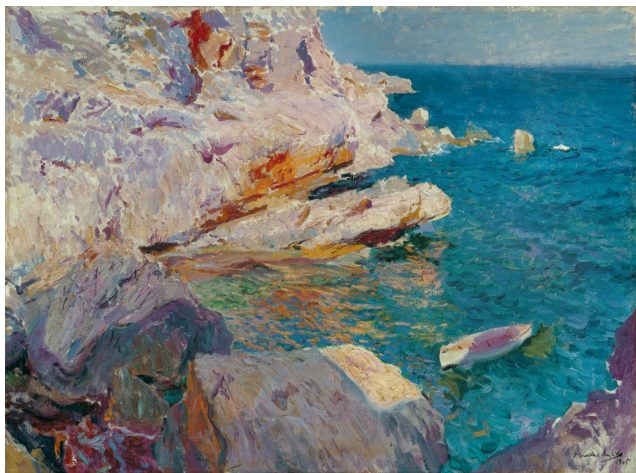
Joaquín Sorolla Bastida (1863-1923) - Les Rochers de Jávea et le bateau blanc , 1905 Musée Carmen Thyssen, Málaga

Si les grands noms de l'art espagnol de la fin du XIX e et du début du XX e siècles sont mondialement réputés (Dali, Miró, Picasso, etc.), une large partie de la création artistique de cette période reste aujourd'hui encore méconnue. Pourtant, de nombreux artistes actifs entre les années 1880 et 1920 ont fait preuve d'une grande vitalité et inventivité, notamment dans le domaine du paysage, en peignant des scènes de plein air animées de somptueux effets de lumière, dans le sillage de certains peintres impressionnistes et postimpressionnistes.