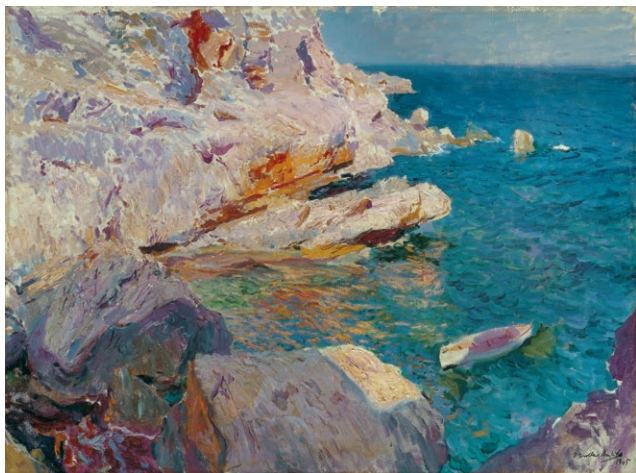
Joaquín Sorolla Bastida (1863-1923) - Les Rochers de Jávea et le bateau blanc , 1905 Musée Carmen Thyssen, Málaga

Si les grands noms de l'art espagnol de la fin du XIX e et du début du XX e siècles sont mondialement réputés (Dali, Miró, Picasso, etc.), une large partie de la création artistique de cette période reste aujourd'hui encore méconnue. Pourtant, de nombreux artistes actifs entre les années 1880 et 1920 ont fait preuve d'une grande vitalité et inventivité, notamment dans le domaine du paysage, en peignant des scènes de plein air animées de somptueux effets de lumière, dans le sillage de certains peintres impressionnistes et postimpressionnistes.