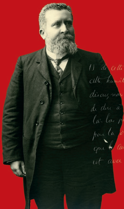
Jean Jaurès, vers 1904